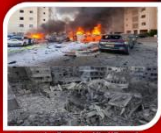
اسریر ۱۹۷۹ اسرائیل و اسریر ۱۹۸۰ عراق

علیه جنگ ارتجاعی علیه توحش سرمایه داری کارگران وطن ندارند!